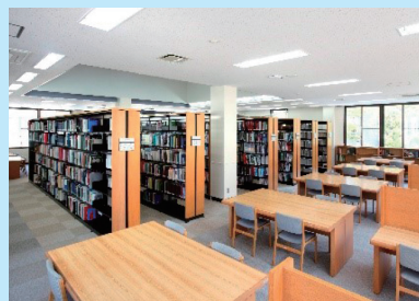
生命科学閲覧室・中央閲覧室