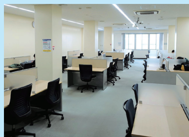
マルチメディアルーム

各種申し込みは、1階カウンターで受け付けています。 本の探し方が分からないなどの相談も、カウンターまで気軽にお声がけください。