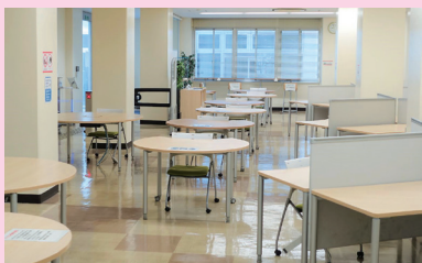
ラーニング・コモンズ