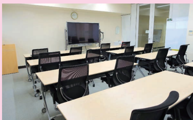
2階ミーティングルーム (要予約・学内者のみ)