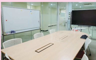
2階グループ学習室 (要予約・学内者のみ)