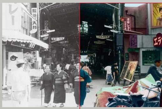
東新町交差点より籠屋町を望む