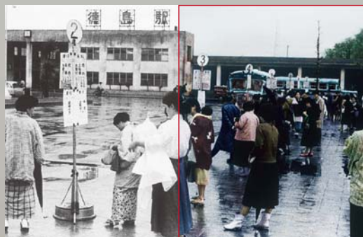
昭和20年代の徳島駅