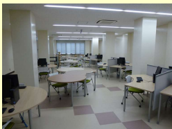
ラーニング・コモンズ